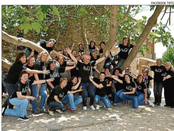
The River Troupe Gospel (TRTG) és format per més de 50 membres i enguany celebra el seu cinquè aniversari. S'estrenaran al Kursaal